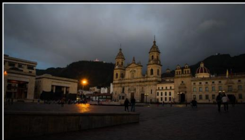
2º Leonardo Infante Aguirre "OCASO EN BOGOTÁ"